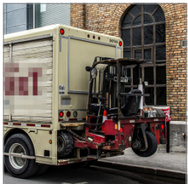
LKW mit Mitnahmestapler / Truck with truck-mounted forklift

Buchung und Gestellung ausschließlich über die offiziellen Servicepartner bzw. Spediteure der Messe Augsburg. / Booking and delivery exclusively via the official service partners or forwarding businesses of Messe Augsburg.