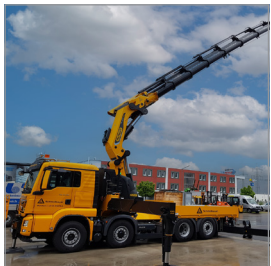
Entladekräne / Unloading cranes

Alle Geräte müssen nach der gesetzlichen UVV (Unfallverhütungsvorschrift) geprüft sein. Der aktuelle Aufkleber muss sichtbar am Gerät angebracht werden. / All equipment and devices must be tested in accordance with the statutory UVV (accident prevention regulations). The valid sticker must be affixed to the equipment in a visible location.