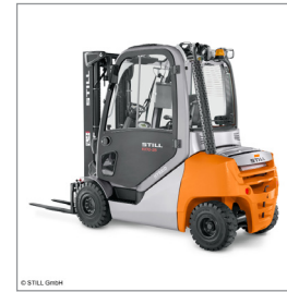
Gabelstapler mit Bedienpersonal / Forklift with operator

Bedienung nur durch ausgebildete Fahrer der Messespediteure / Use exclusively by qualified drivers from the trade fair forwarding businesses