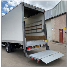
Mitläufer (Niederhubwagen) / Truck with lifting platform (tail lift)

Be- und Entladung mit Hebebühne in Kombination mit Handhubwagen oder Schnellläufer ohne Standplattform möglich / Loading and unloading with lifting platform in combination with hand pallet truck or high-speed truck without a standing platform is permitted